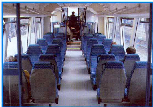
Beispiel für die Innenraumgestaltung (hier RS1 für SWEG)